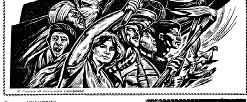
И. Сидорова. «В ритме музыки» (фрагмент)

СО СТЕНОВ БЕССОНОЧНОЙ ХУДОЖЕСТВЕННОЙ ВЫСТАВКИ, ПО РЕВЯЩИМУ ПУТИ.