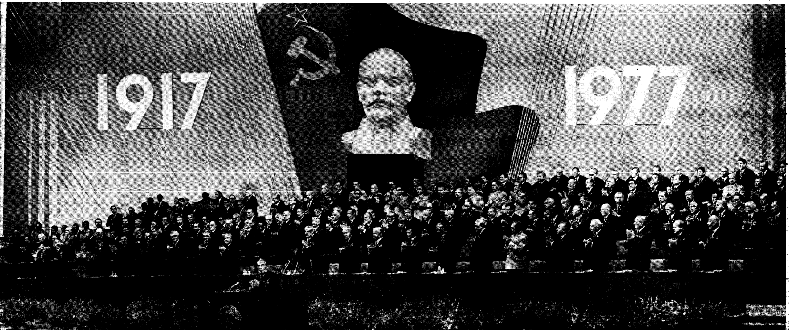
Москва. Кремлевский Дворец съездов. 2 ноября 1977 года. Президиум совместного торжественного заседания Центрального Комитета КПСС, Верховного Совета СССР и Верховного Совета РСФСР, посвященного 60-летию Великой Октябрьской социалистической революции.